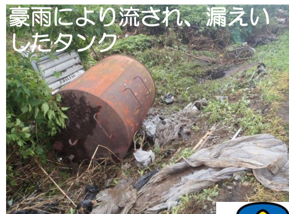
豪雨により流され、漏えいしたタンク